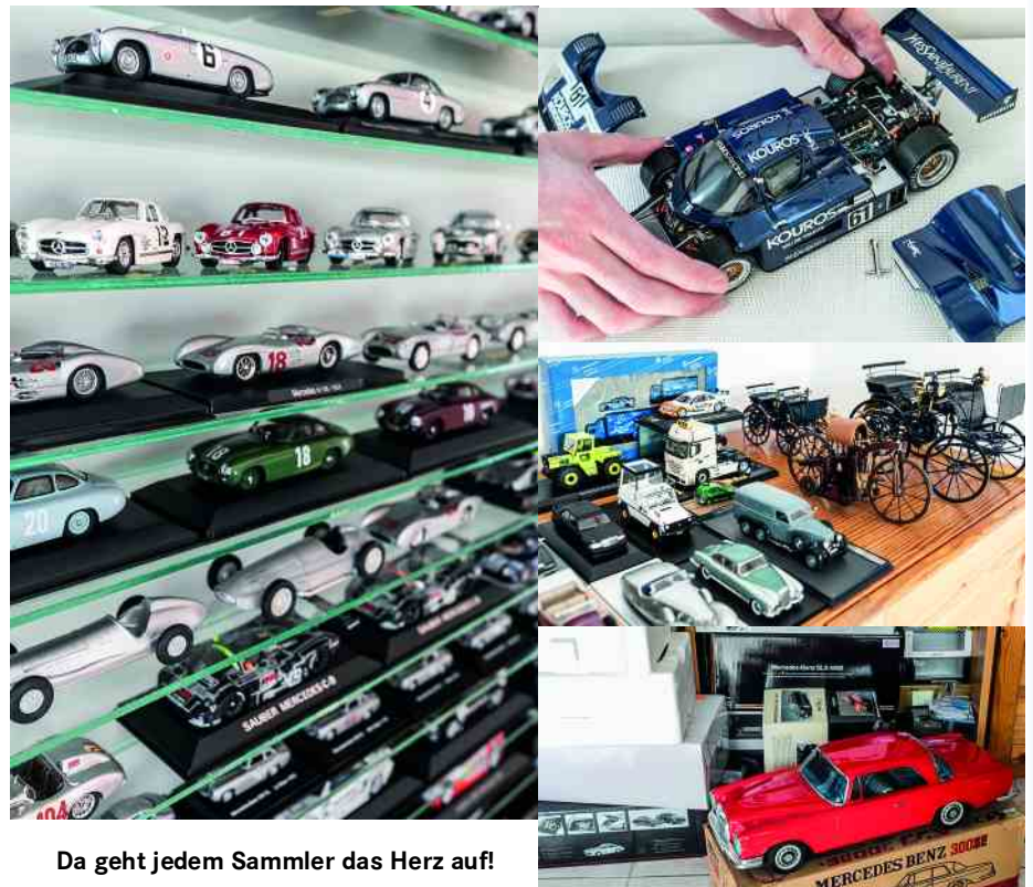
Da geht jedem Sammler das Herz auf!