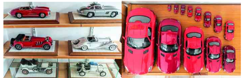
Damals hatten die Modelle noch Charakter.