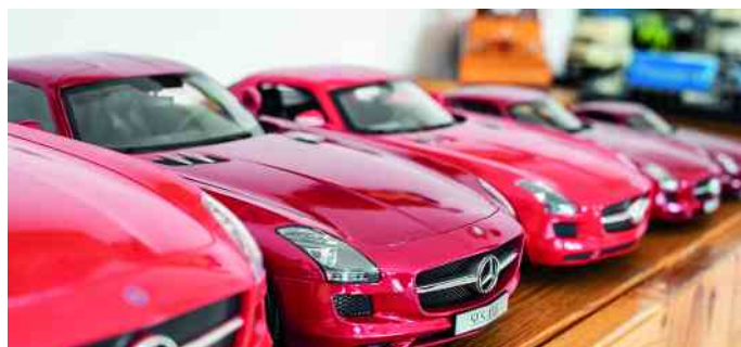
Wir sammeln Modellautos mit dem Stern